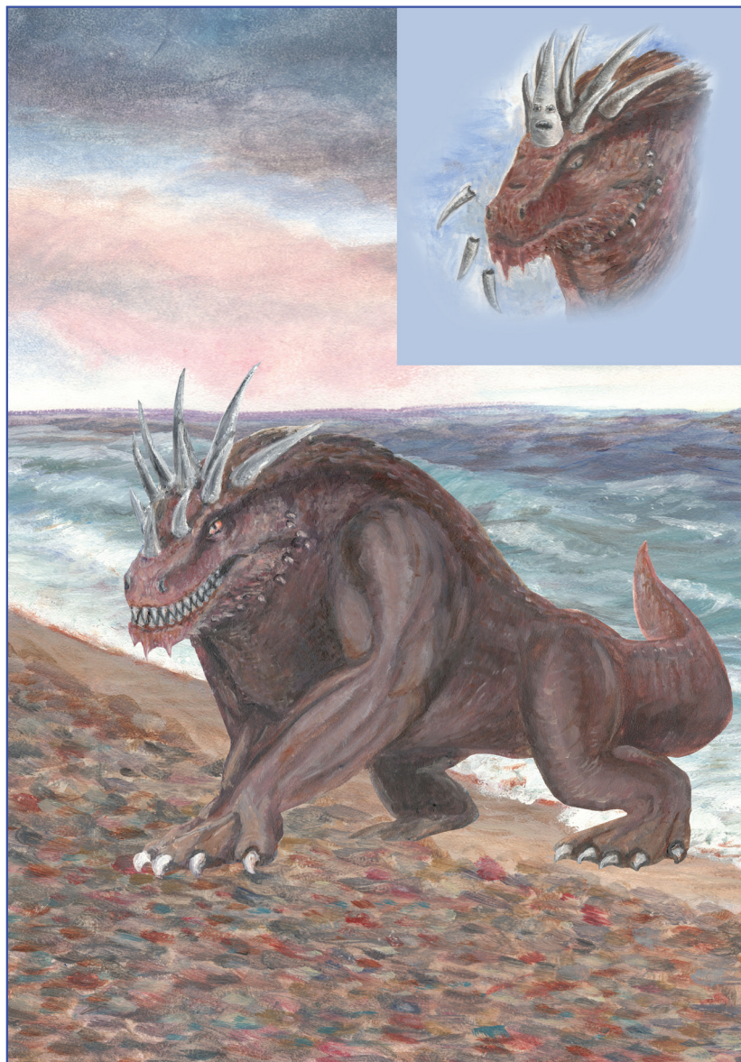
Яплэнэрэ хьэКІэ-кьуакІэу бжъакьохэр зытетэу Даниел нэфапІэу ыльэгьугьэр (7:7-8)