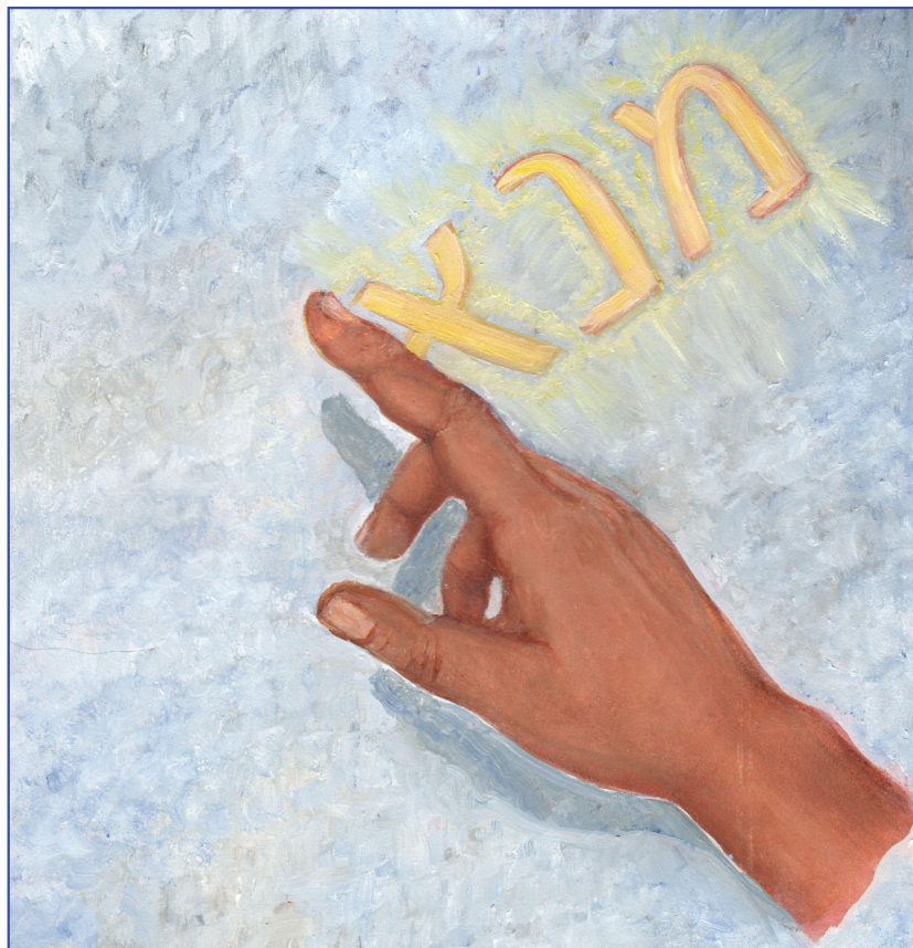
Дэпкым тетхэгъэ гущыІэхэр (5:5)