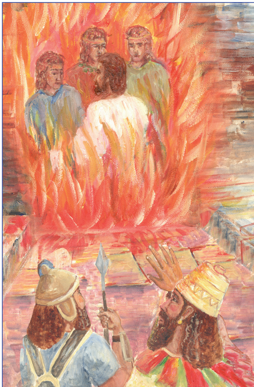
Зэшьэогъу нэбгырищэу хьаку гьэпльыгьэм радзагьэхэр (3:24-25)