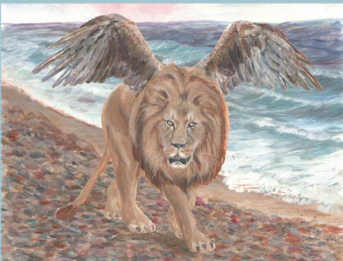
Даниел хьэКІэ-кьокІищэу нэфапІэу ылъэгъугъэхэр (7:3-6)