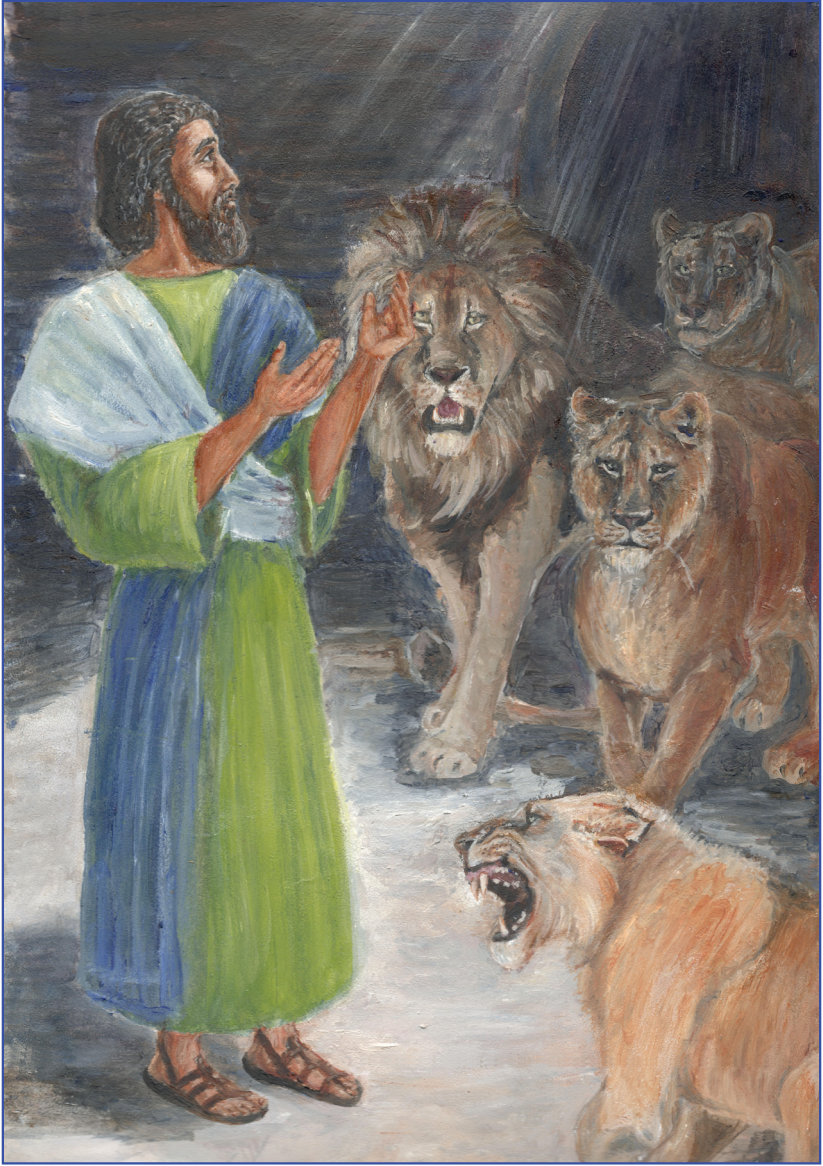
Даниел аслъанхэр зэрыс машэм зэрэрадзагъэр (6:16)