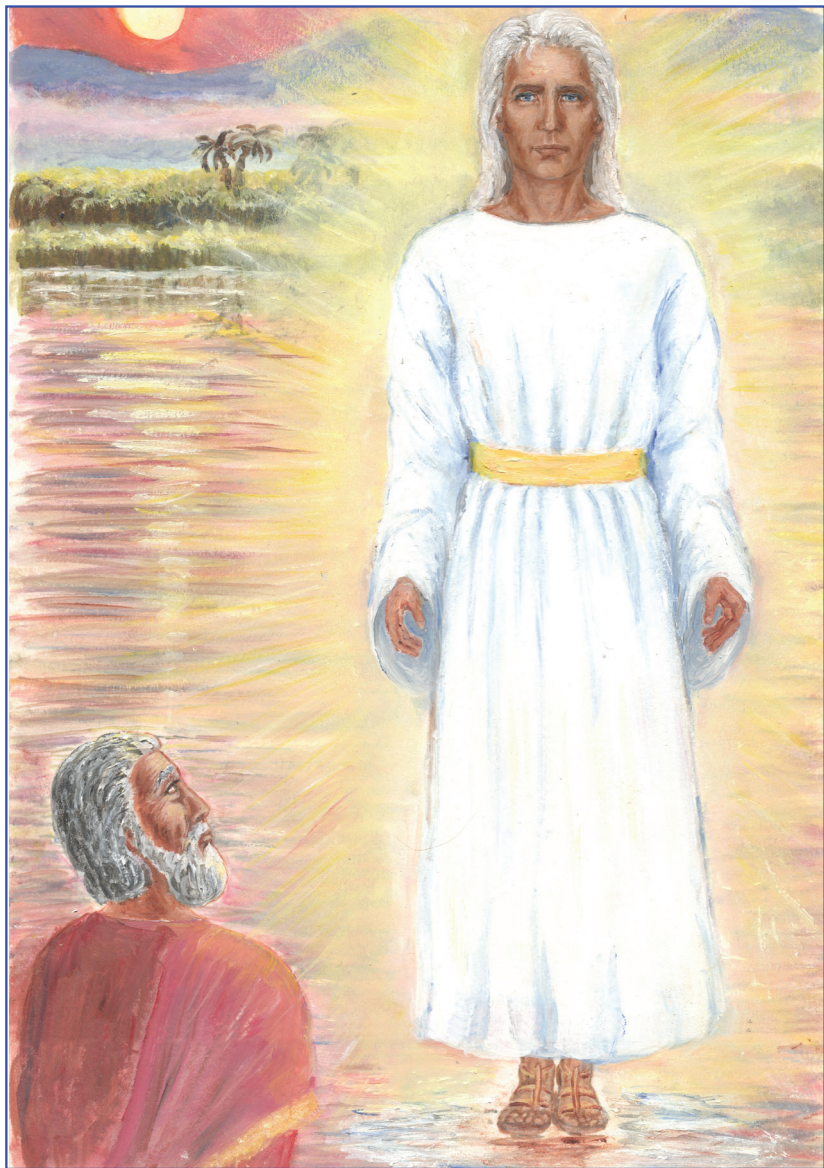
Даниел псыхъоу Тигр дэжь нэфапӀэу щильэгъугъэр (10:4-6)