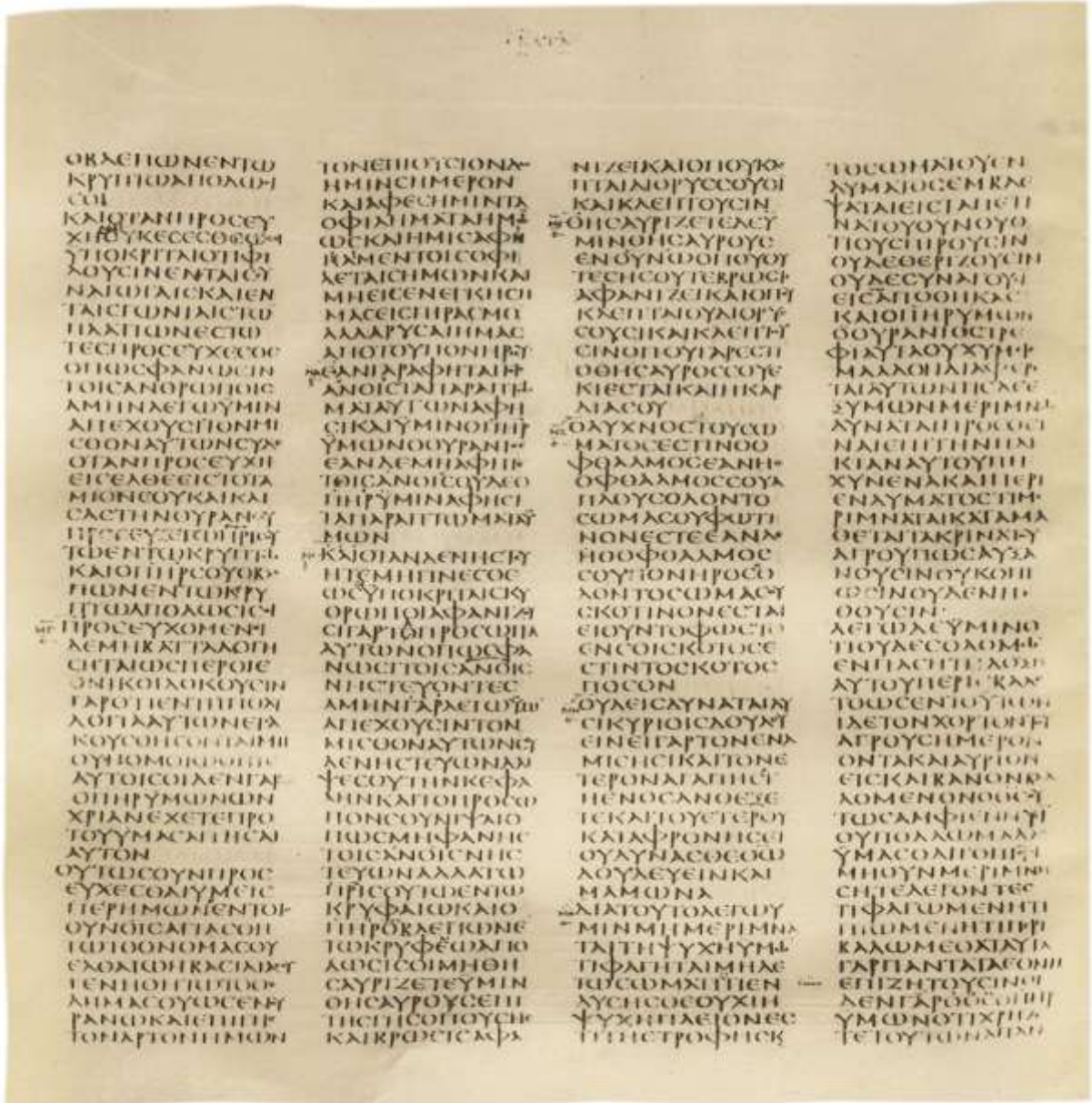
Янги Ахднинг қўлёмаларидан “Кодекс Синайтикус” Матто баён этган муқаддас Хушхабардан олинган бу юнонча қўлёмза тахминан милодий 340 йилларда кўчирилган