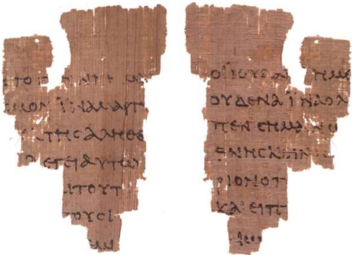
Янги Аҳднинг қўлёзмаларидан “Папирус 52” деб аталган парча Юҳанно баён этган муқаддас Хушxabардан олинган бу юнонча қўлёзма тахминан милодий 125 йилларда кўчирилган